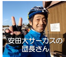
安田大サーカスの団長さん