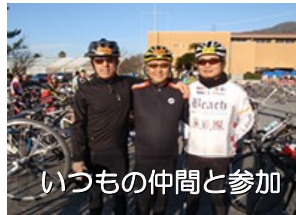
いつもの仲間と参加

下蒲刈島・上蒲刈島・豊島・大崎下島・岡村島をそれぞれ1周する90kmのコースですが、初回にもかかわらず1200名もの参加者があり、安田大サーカスの団長がホストを務めて盛り上げてくれました。