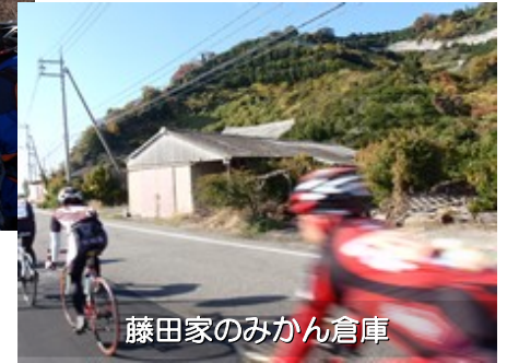
藤田家のみかん倉庫