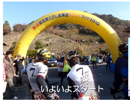
いよいよスタート