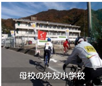
母校の沖友小学校

私の学んだ沖友小学校が補給ステーションになっていたのですが、一年の走り納めに生まれ故郷を走れたことは良い思い出になりました。