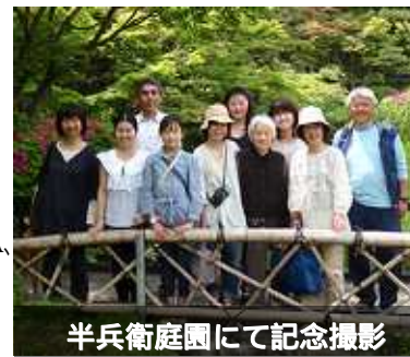
半兵衛庭園にて記念撮影

私は「90歳まで、現役の歯科医」という目標を達成する為に、筋トレ、自転車のトレーニング等に励んでいます。年をとるとトレーニングの後の疲れが取れにくくなるのですが、筋トレの先生に教えて頂いたプロテイン、BCAA、ビタミン、EPA/DHA(魚の油成分)等のサプリメントを積極的に取るようにしています。そのせいか、白髪が減ってきたように思います。適度なトレーニングと栄養を取ることで、老化を遅くすることができるのではないかと思います。