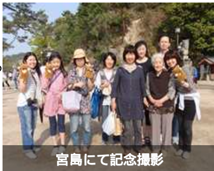
宮島にて記念撮影

母親は現在83歳ですが、最近物忘れが進んで来たので週に4日くらいデイサービスに通っています。