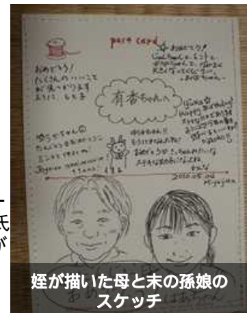
姪が描いた母と末の孫娘のスケッチ

ここ2~3年はエベレスト登山で有名なプロスキーヤーの三浦雄一郎氏の生き方を学ぼうと、三浦氏主催の登山や、スキーツアーに参加していますがとても76歳とは思えないほど元気です。80歳でまたエベレストに挑戦するそうです。