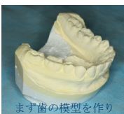
まず歯の模型を作り