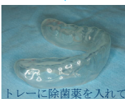
トレーに除菌薬を入れて